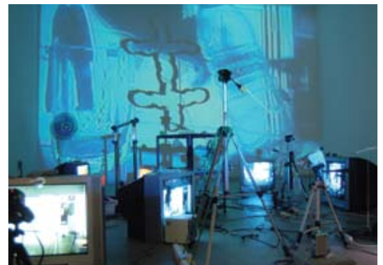
泉太郎 | Taro Izumi